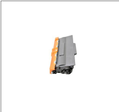
CÔTÉ GAUCHE CARTOUCHE