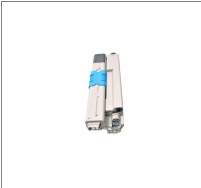
CÔTÉ GAUCHE CARTOUCHE