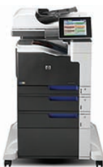
Imprimante multifonctions couleur HP LaserJet Enterprise 700 M775f