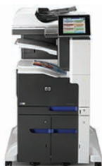
Imprimante multifonctions couleur HP LaserJet Enterprise 700 M775z+