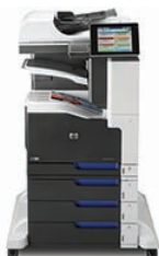
Imprimante multifonctions couleur HP LaserJet Enterprise 700 M775z