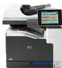
Imprimante multifonctions couleur HP LaserJet Enterprise 700 M775dn