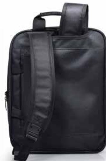
Convertible bag, removable soulders Sac convertible, bretelles amovibles