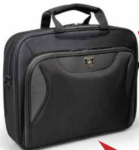
Top loading case position Position sacoche top loading