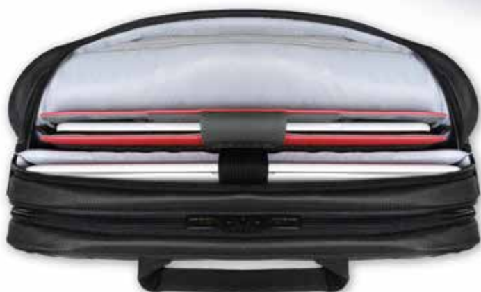
Laptop/tablet compartments Compartiments laptop/tablette