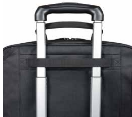
Trolley strap Sangle pour trolley

Photos submit to change/Photos non contractuelles