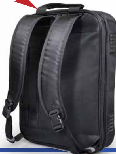
Backpack position Position sac-à-dos