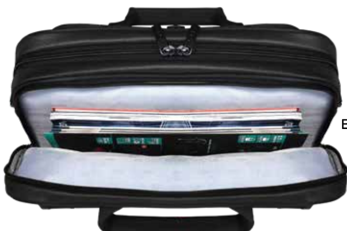
Backfile for A4 documents Compartment pour documents A4