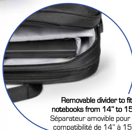
Removable divider to fit notebooks from 14" to 15,6" Séparateur amovible pour une compatibilité de 14" à 15,6"