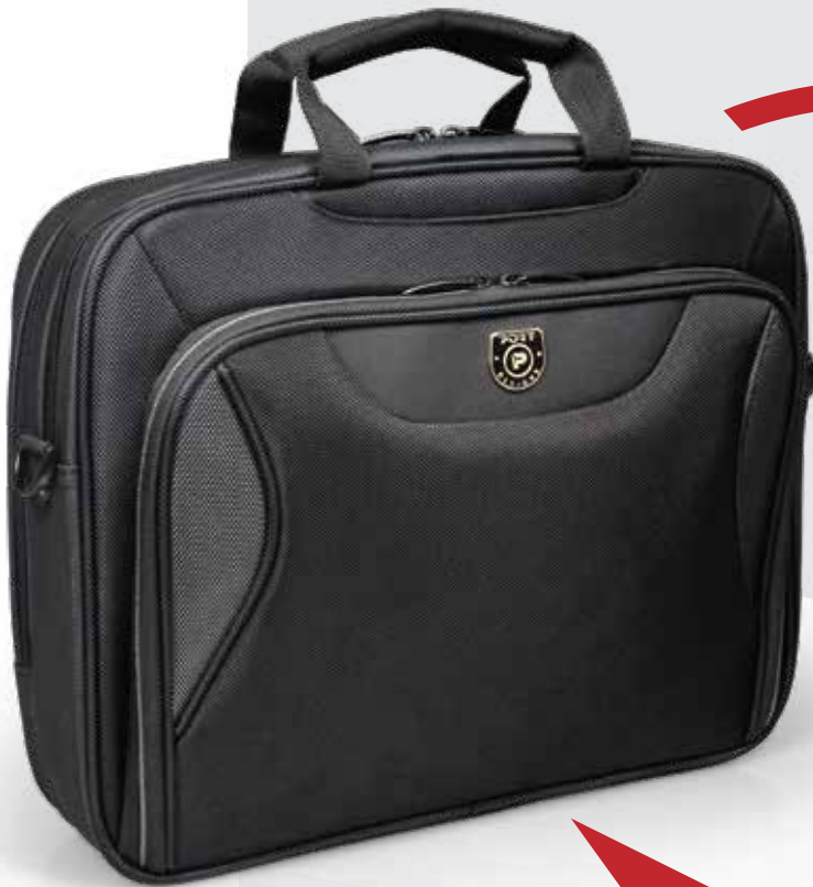
Top loading case Sacoche top loading