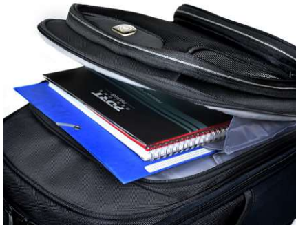
DOUBLE A4 DOCUMENT COMPARTMENT DOUBLE COMPARTIMENT POUR DOCUMENTS A4