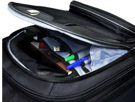
LARGE ORGANIZER POCKET FOR ACCESSORIES GRANDE POCHE AVEC ORGANISEUR POUR ACCESSOIRES