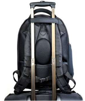
TROLLEY STRAP FOR ROLLING LUGGAGE HANDLE SANGLE POUR POIGNEE DE BAGAGES A ROULETTES