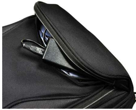
FRONT POCKET DEDICATED FOR NOTEBOOK POWER ADAPTOR POCHE AVANT DEDIEE POUR CHARGEUR D'ORDINATEUR