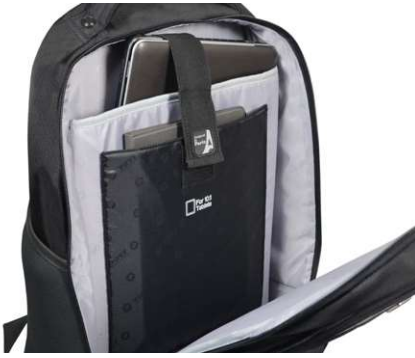
PROTECTIVE PADDED LAPTOP & TABLET COMPARTMENTS COMPARTIMENTS PROTECTEUR MATELASSE POUR ORDINATEUR ET TABLETTE