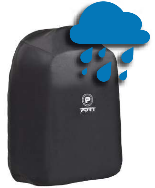
REMOVABLE WEATHER RESISTANT RAIN COVER COUVERTURE DE PLUIE AMOVIBLE